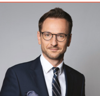
Waldemar Buda Minister Rozwoju i Technologii.

Oprócz ułatwień dla przedsiębiorców, o których wspominałem wcześniej, skupiamy się na pomocy