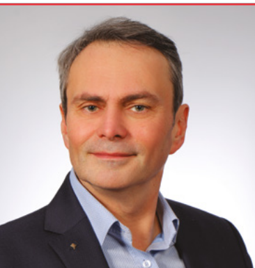
Tomasz Ciodyk – Prezydent Polskiej Federacji Stowarzyszeń Rzeczoznawców Majątkowych

Podstawa wyceny zależy od tego, jakie podejście stosuje przy wycenie rzeczoznawca majątkowy. W podejściu porównawczym wycena następuje na podstawie cen nieruchomości podobnych, które były przedmiotem sprzedaży na analizowanym rynku. Podejście dochodowe bazuje na możliwym do uzyskania dochodzie z nieruchomości, którym jest najczęściej możliwy do uzyskania czynsz najmu lub czynsz dzierżawny. Z kolei w podejściu kosztowym wartość nieruchomości odpowiadać będzie kosztom jej odtworzenia pomniejszonym o wartość zużycia. Wynikiem zastosowania podejścia porównawczego i dochodowego jest tzw. wartość rynkowa nieruchomości, czyli mówiąc w skrócie: szacunkowa kwota, jaką można uzyskać za nieruchomość przy sprzedaży na warunkach rynkowych.