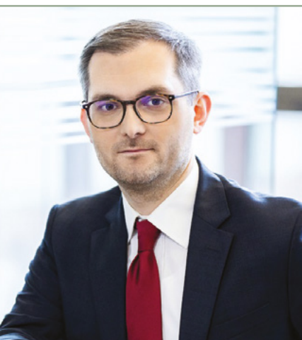
Marek Niedużak Wiceminister Rozwoju, Pracy i Technologii

Osoba wyznaczona na zarządcę sukcesyjnego musi wyrazić zgodę na objęcie funkcji. Gdy zarządcę sukcesyjnego powołuje przedsiębiorca, jego zgoda wymaga sporządzenia umowy pisemnej. Po śmierci przedsiębiorcy, zgoda zarządcy sukcesyjnego musi być wyrażona przed notariuszem.